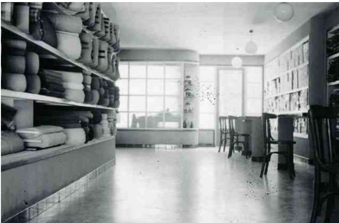
Interior de la botiga els anys 40 del segle passat

La Núria, que es casà el 1967 amb el Ramon Passada i Clotet, ha seguit el negoci. El matrimoni tingué quatre fills, el Joan-Marc, el Raimon, la Glòria i la Núria, amb les qui continua l'establiment.