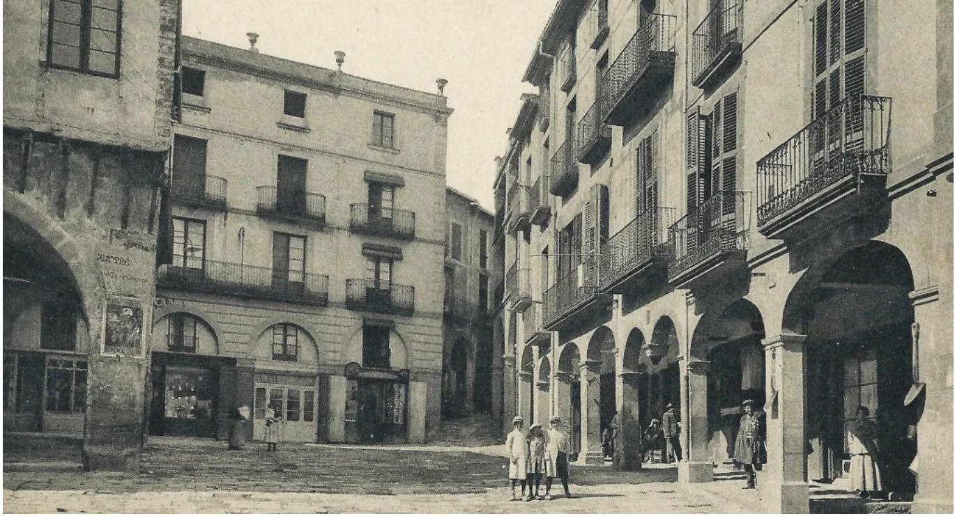
Plaça Major de Solsona.

l'orgull dels pobles, fou un objectiu que els titulars del municipi sempre tingueren present.