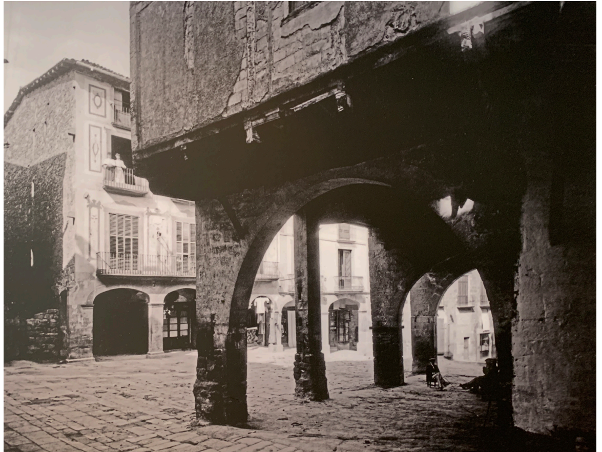
Fotografia de la plaça Major a principis de segle XX

Va ser al 1444 que se li va canviar el nom a Plaça Major