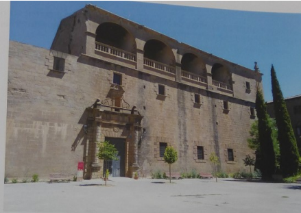
Santuari del Miracle

Allí tienen presas a las Hermanas que habían encontrado en la casa de la Vela al ir hacer el registro: