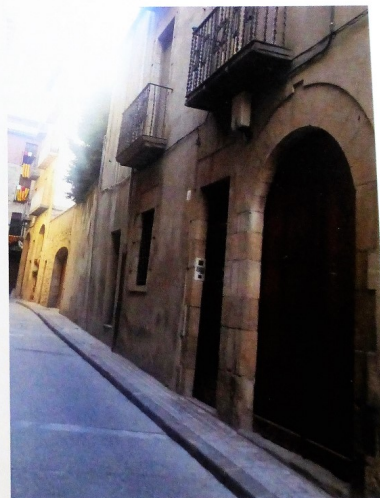
Casa Bonay situada en la C. Sant Roc de Solsona, 5