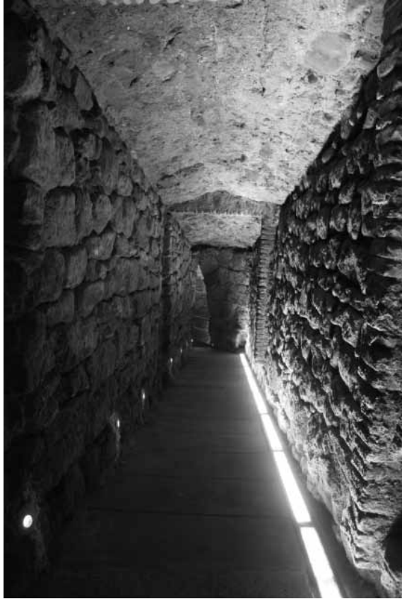
Corredor d'entrada del pou de gel que es va veure afectat parcialment per la construcció del pont d'entrada a la ciutat del s. XVIII.

el nom, els proposa un tracte amb unes condicions que, en cas d'acceptar-se, acabarien amb l'entrega, sense cap cost per al municipi, d'un nou pou de gel a Solsona, que es construiria prop del portal d'en Travesset –avui desaparegut–, i a tocar de la ribera de l'Aumeda, « Per lo que se ha ajuntat a V. M. s és que alguna persona desta ciutat ha instat se proposàs a V. M. s que si volien donarli lo pou del gel per 300 ll. quiscun any que dins deu anys los donarie un altre pou fet a son gasto serca del portal del Travesset ».