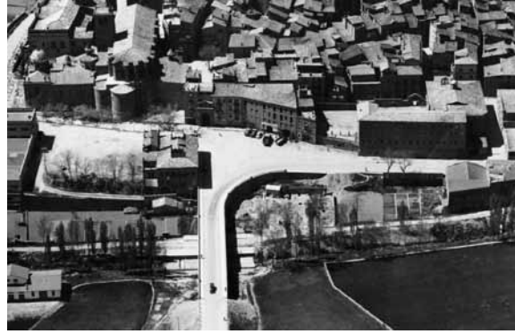
Vista aèria de Solsona a la dècada del 1950. En el centre, la plaça del Pont.

des de l'1 de juny, per un import de 50 pessetes anuals. 47