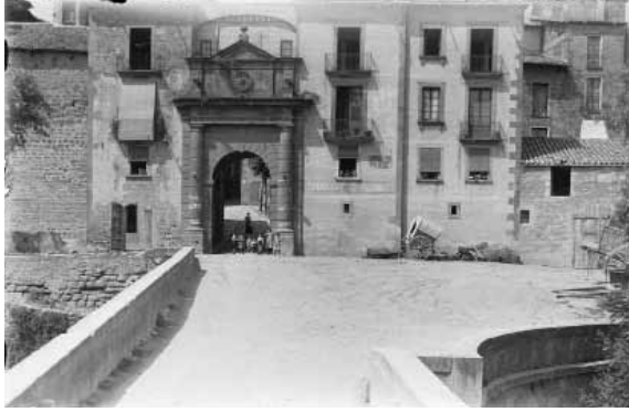
Vista de l'entrada a Solsona des del pont a la segona dècada del s. XX. A la dreta, l'esplanada de la plaça del Pont.