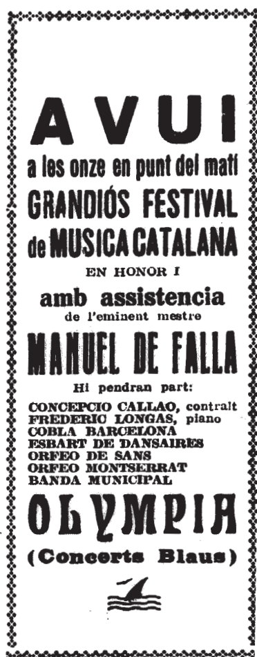
Cartell del Festival de Música Catalana en honor a Manuel de Falla, celebrat al 22 de març de 1927 al Teatre Olympia de Barcelona. En aquest concert, la Banda Municipal de Barcelona va interpretar la Glossa del Ball de Gegants de Solsona i també va estrenar les transcripcions per a banda realitzades per Joan Lamote de Grignon de tres obres de Falla: Nana , Jota i la Danza Ritual del Fuego (de El Amor Brujo ), composicions que va dirigir el mateix compositor.