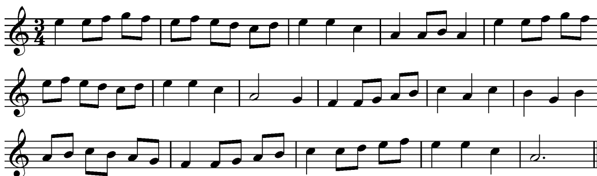
Melodia transposada per a flabiol (en fa ).

primera melodia del quadern B coincideix molt amb la melodia del Ball de Gegants de Solsona . Que l'organista escollís aquesta tonada per obrir el quadern pot indicar que era un tema conegut i reconegut a la ciutat.