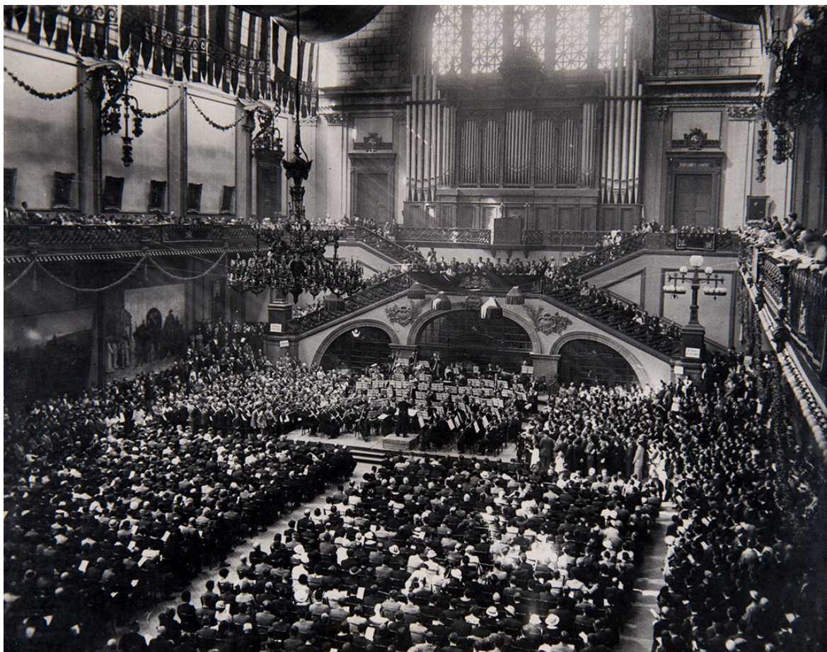
Concert de la Banda Municipal de Barcelona al desaparegut Palau de Belles Arts, obra de l'arquitecte oriünd de Solsona, August Font i Carreras. Dècada del 1930.

enllà de la seva natural circumscripció als límits funcionals del ball.