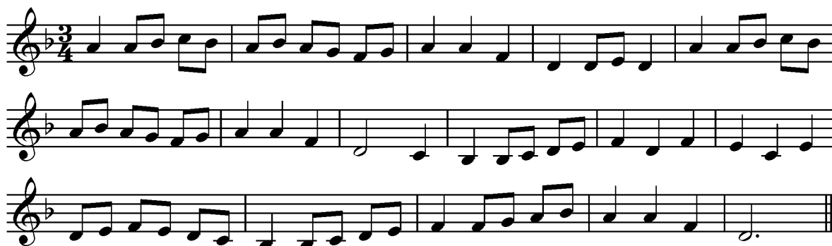
Melodia número 1 del Quadern de llibertat d'orgue de 1872 (B).