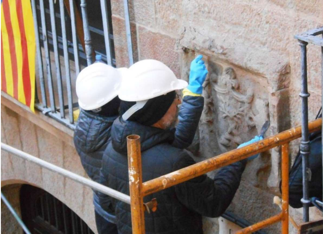
Restaurant l'escut de la façana de l'ajuntament

NacióSolsona – Solsona - 17 de gener de 2019