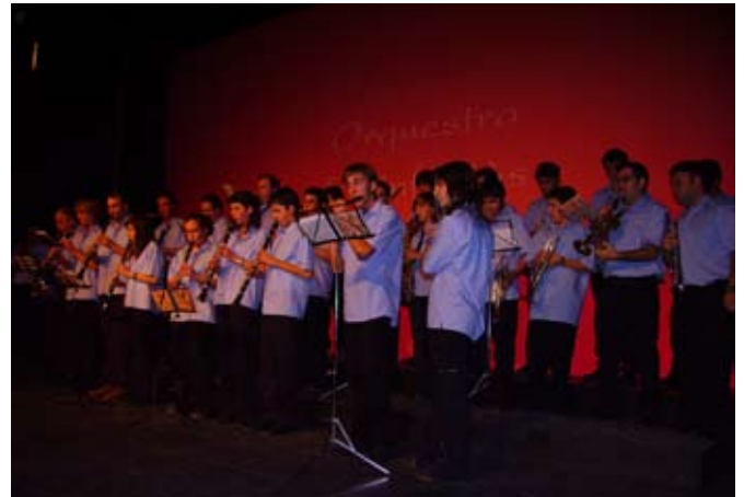
L'Orquestra Patinanjàs va tocar La Geganta Jove i El Bufi

Des de la seva creació, les actuacions de la PFJ van anar en augment: en els primers temps, a Solsona –Carnaval, Corpus, Festa Major, cavalcada de Reis, festa de sant Antoni, Fira de sant Isidre, festa de Sant Cristòfol o Pasqua- i al Solsonès –Ardevòl, Olius, Hostal Nou (Peracamps), el Pi de Sant Just (Olius) i Sant Llorenç de Morunys. Més endavant, a moltes ciutats de Catalunya –Sant Julià de Vilatorrada, Olesa de Montserrat, Lleida, Oliana, Barcelona, Sallent, Cardona, Sant Guim de la Plana-, i a Andorra la Vella.