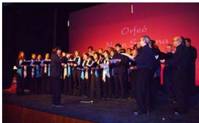
L'Orfeó Nova Solsona va interpretar "Oh! Solsona, bella Solsona" i "La Sardana de Solsona"