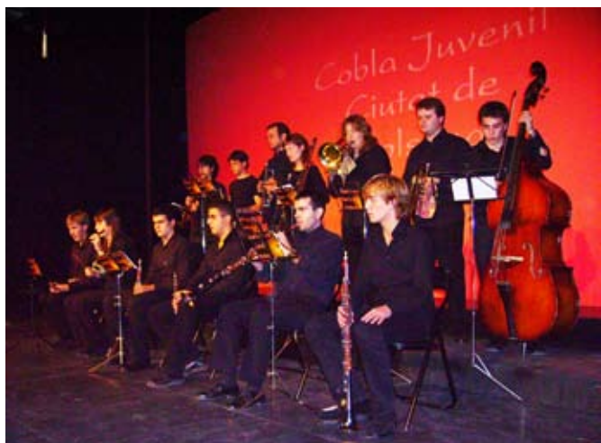
La Cobla Juvenil Ciutat de Solsona va interpretar Alba i El campanar del meu carrer