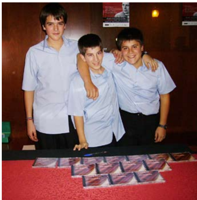
A l'entrada del Teatre ja es podia adquirir el disc de la Patinjanjàs

Durant l'acte es va anar projectant un audiovisual. La part final de l'espectacle va ser un passi d'imatges del mestre Roure acompanyades d'una emotiva banda sonora i unes paraules de comiat final que van tornar a fer esclatar d'aplaudiments tota la sala.