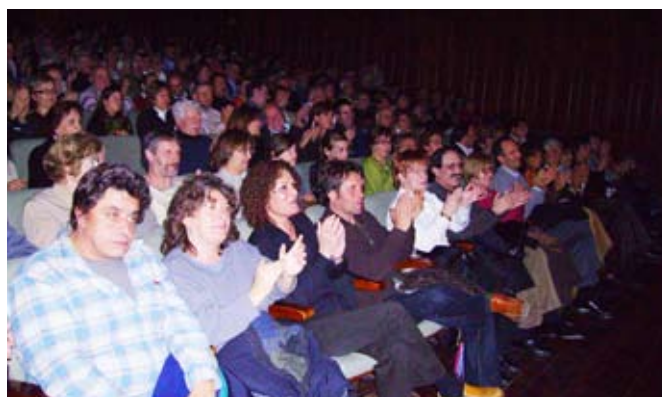
A primera fila del Teatre, família de l'homenatjat i autoritats de la ciutat