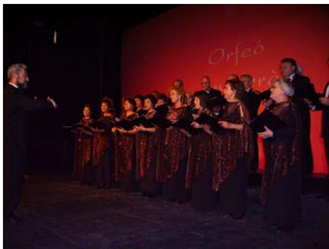
L'Orfeó Andorrà va cantar Adéu bonica Andorra i L'Andorrana

Cal recordar, per últim, les cent disset persones que, amb la seva afició a la música, han fet possible, des de 1976, l'existència de l'orquestra Patinjanjàs.