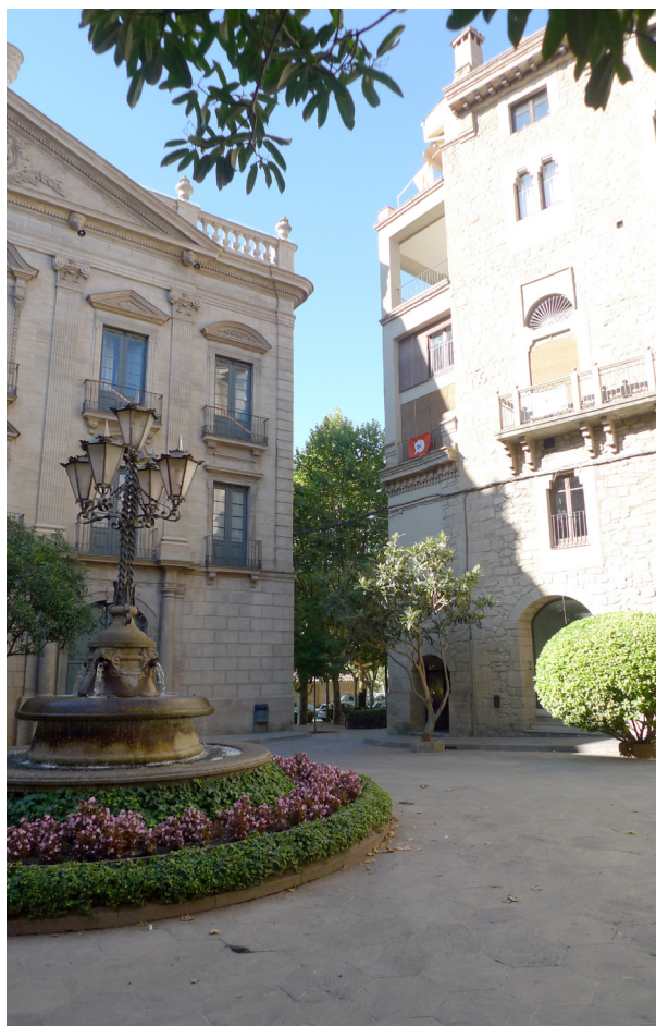
Plaça del Palau Episcopal amb l'entrada de Dafnys al fons