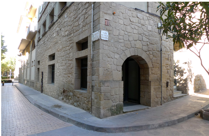
Indret on s'ubicà Dafnys entre els anys 1971 i 1973, fins fa poc hi havia un banc