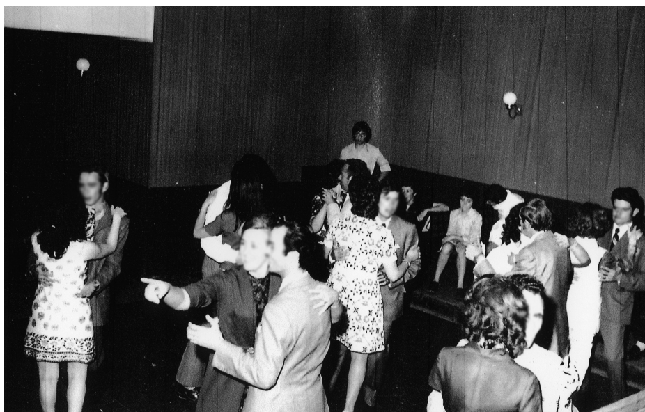
Alguns solsonins gaudint de la música de Dafnys

L'entrada de la Dafnys era per l'arcada que encara es manté avui en dia, gairebé amb la cantonada del Vall Calent, allà hi havia la taquilla i baixant unes escales hi havia la pista, just a l'indret on hi havia hagut el taller, i una barra. Al principi va ser un lloc de moda a Solsona. Els diumenges a la tarda hi podien entrar més de 100 persones a ballar els temes que en aquell temps estaven a l'ordre del dia. Les noies tenien entrada gratuïta, mentre que els nois havien de pagar entre 15 i 20 pessetes per accedir a l'interior del local. A la Dafnys també s'hi feien trobades, com les dels quintos.