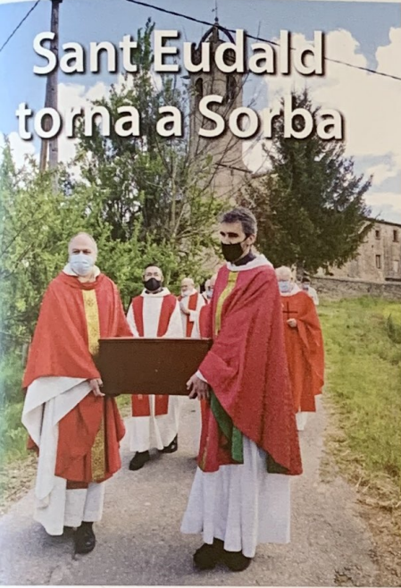
Sant Eudald torna a Sorba

Setmanari d'informació de Solsona i comarca