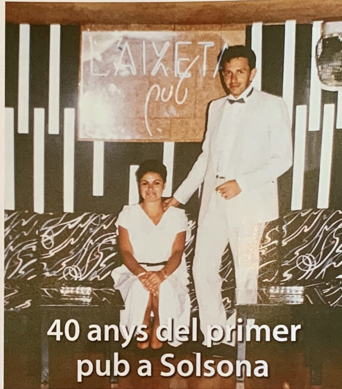
40 anys del primer pub a Solsona