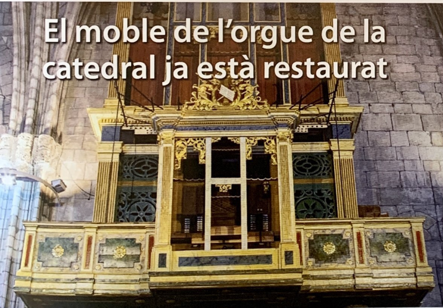
El moble de l'orgue de la catedral ja està restaurat