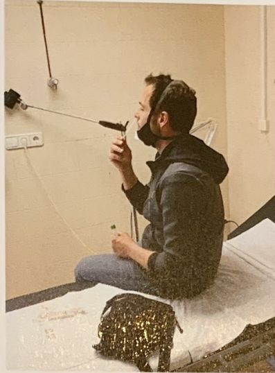
Autocribratge a Solsona