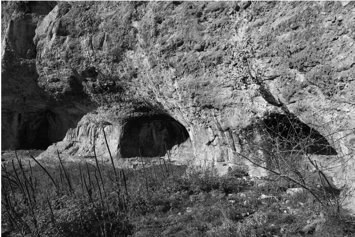
Espluga Melera – Odèn (cova núm. 68)