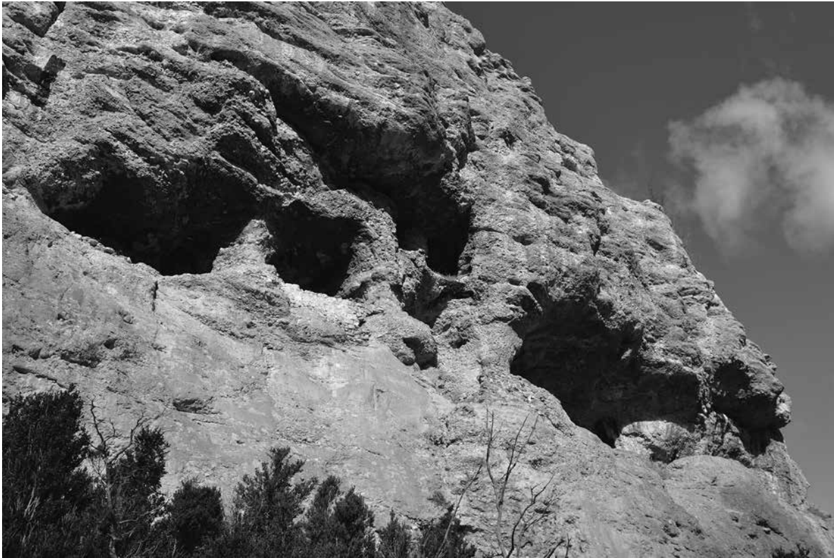
Coves o Forats dels Moros – Odèn (cova núm. 18)