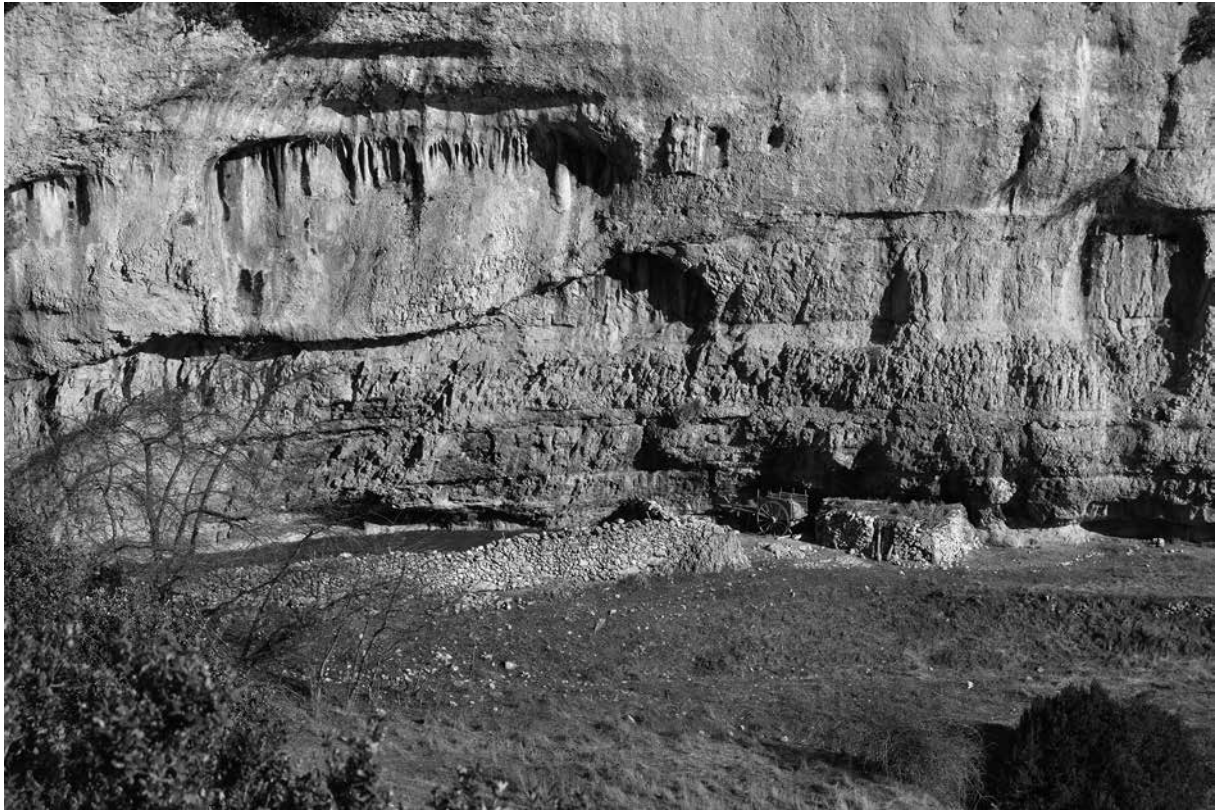
Espluga de Cordes – Odèn (cova núm. 66)