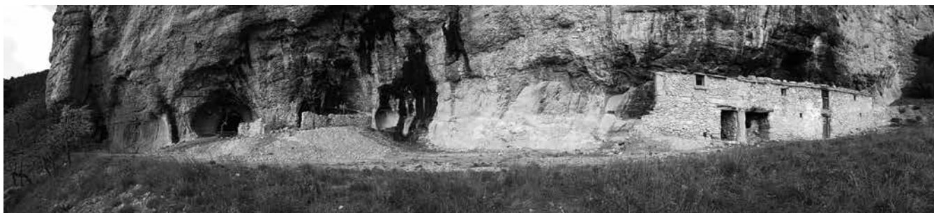
Vista general de la balma de cal Cavallol – Odèn (cova núm. 20)