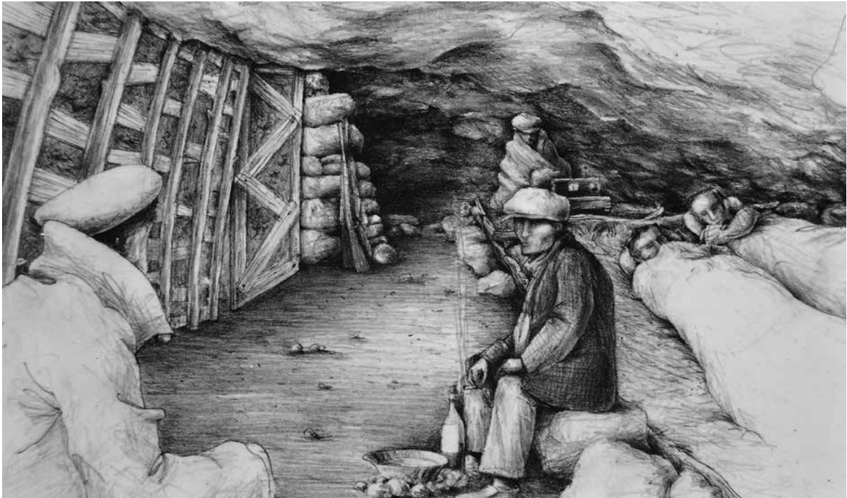
Recreació de la Balma del Xalet – Navès (cova núm. 40). Autor: Òscar Barcelón