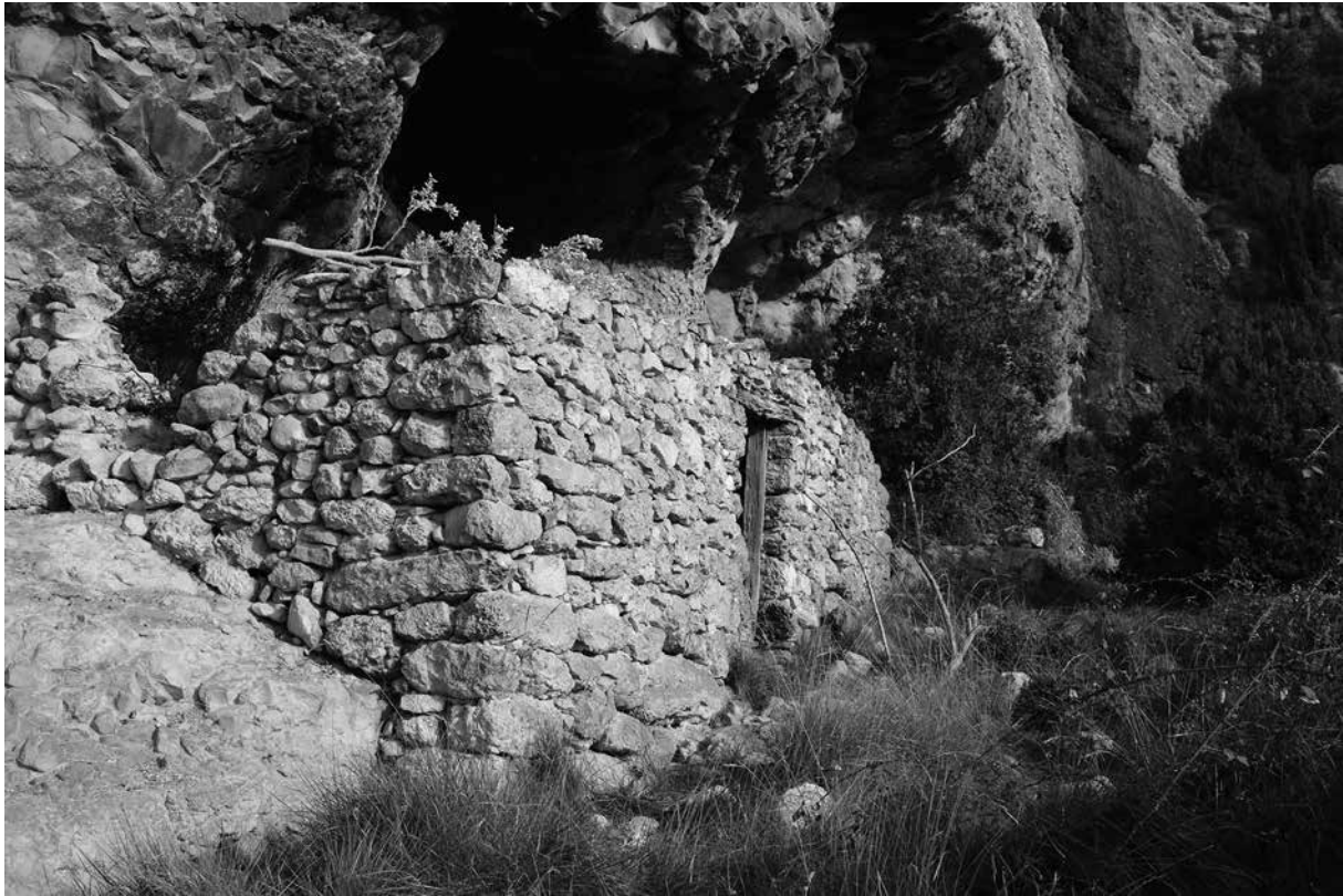
Balma de ca l'Andreu – Odèn (cova núm. 19)

De l'edifici solament se'n conserven algunes parets i la porta. Sembla que va ser habitada fins a la meitat del s. XX. (Aymamí, 2011, 50)