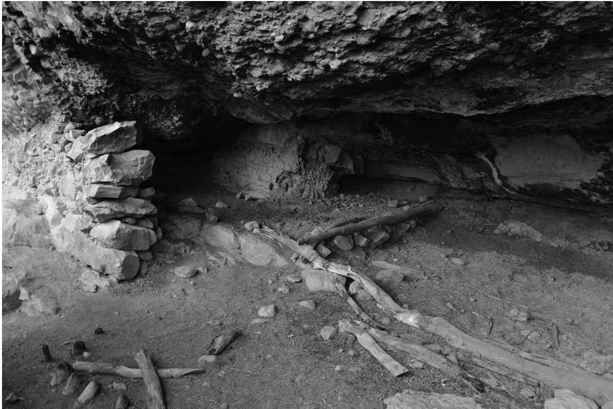
Balma del Xalet – Navès (cova núm. 40)