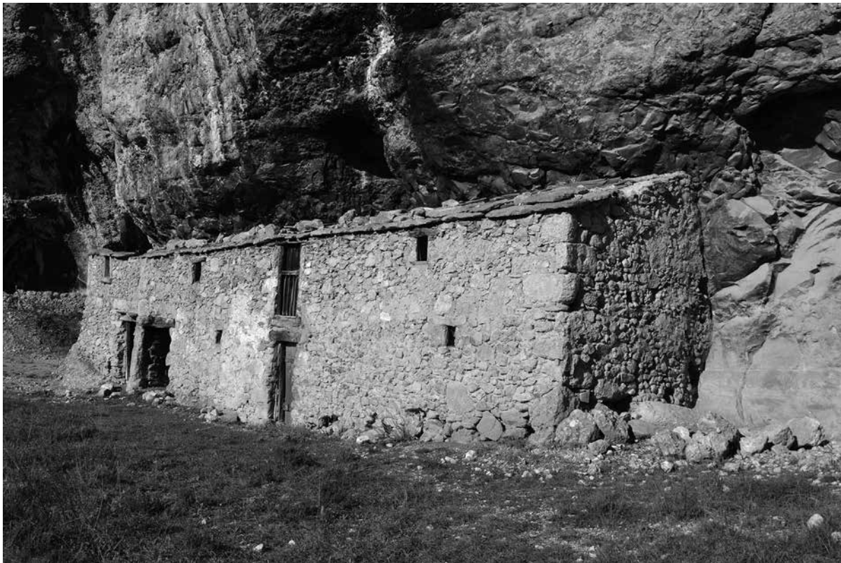
Balma de cal Cavallol – Odèn (cova núm. 20)

tocar a la paret. Al mig hi ha un habitacle amb paret de pedra seca, en forma circular, que tanca al sostre i a la roca. Té una porta petita i una finestreta. Pel darrera hi ha una petita cambra a sota d'una gran roca després del cingle que comunica amb un altre habitacle. Aquest conducte segurament era aprofitat per fer-hi foc per escalfar les estances. Aquest darrer, el més occidental, té una paret de pedra seca, de poca alçada. Aquesta casa troglodita podria ser una de les primeres cases de tot el veïnat de la