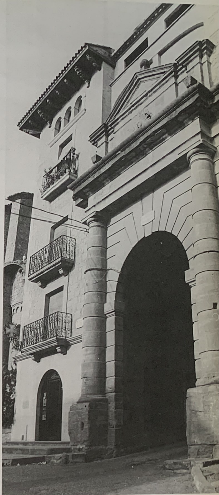
El Portal del Pont, amb el símbol del sol

La fonda és un negoci que vol foc lent i temps