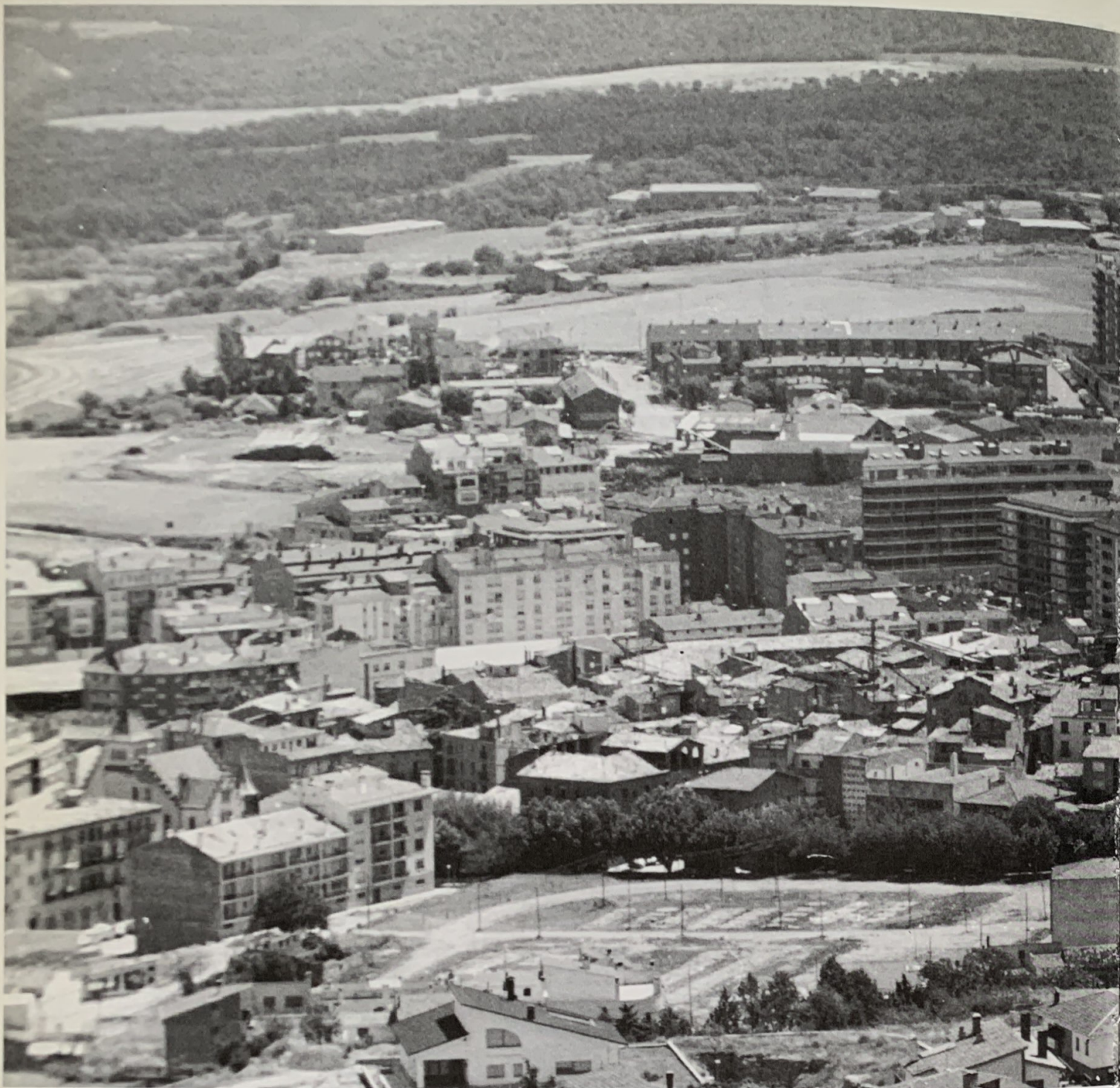
Panoràmica de Solsona des del campanar de la catedral El Castellvell és a l'origen i a la fi de totes les aparicions i de tots els records de Solsona