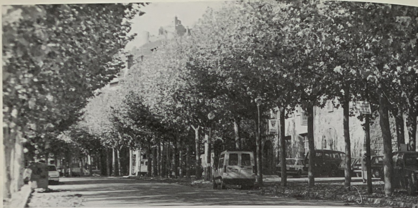
Sorprenent aparició del Castellvell per damunt dels plataners del Vall Calent de Solsona

El Vall Calent és la cara calenta de l'obac carrer Llobera. A l'espai del sol s'hi arriba per passos semi-privats com les escaletes de la Caixa de Pensions