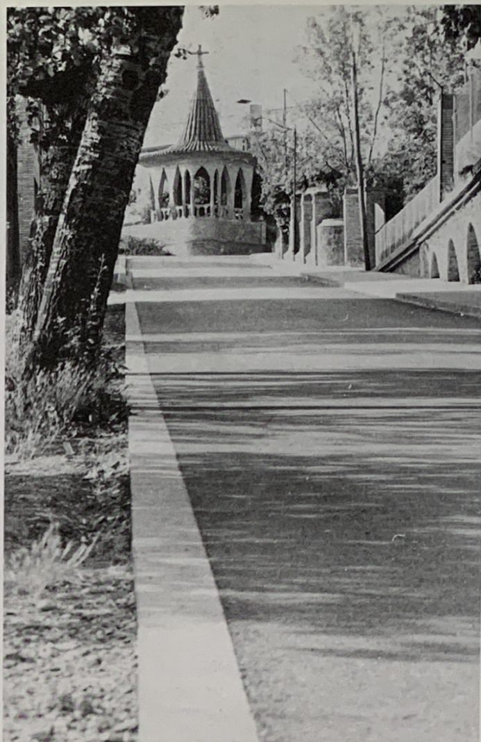
La pujada del Seminari, endreçada fa poc amb un pulcre asfalt El mirador de la Torre de la vil.la Riu vindria a ser alguna cosa així com la cirera borratxa i ensucrada que coronés el cim d'un pastís cerimonial i eixut fet de l'eclesial pa de pessic