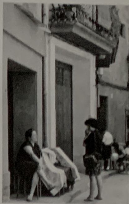
Zona del carrer de Sant Salvador Maria Fortó, la 'Dona dels Trossos' asseguda en una cadira, a la vora de les mostres de teles. A dalt podeu veure l'antic empedrat del carrer que comunica la placeta Sant Salvador amb la plaça de Sant Joan