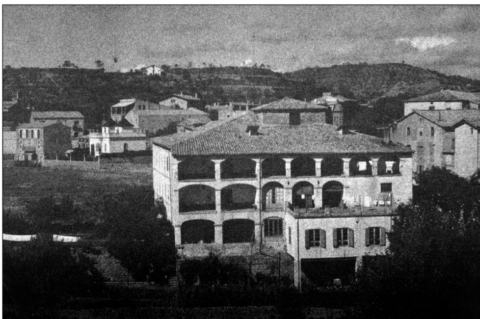
A sobre: l'Hospital de Llobera fundat l'any 1411. A sota: l'Hospital Peremàrtir Colomés construït l'any 1639.