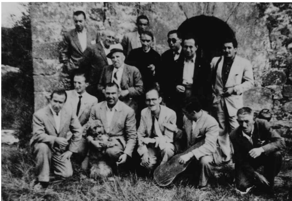
Fotografia dels primers aplegats davant la capella de Viladebages. Anys 50.