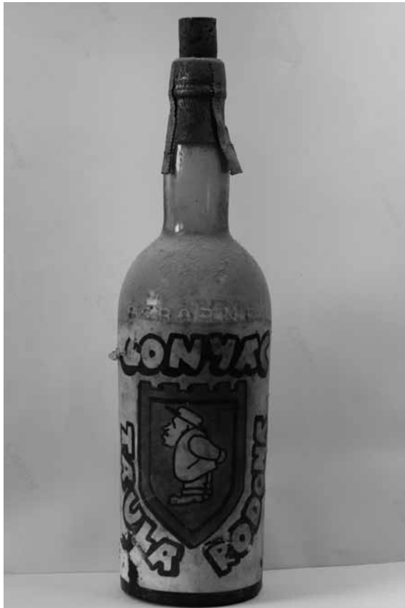
Una de les primeres ampolles de cognac etiquetades per la Taula rodona.