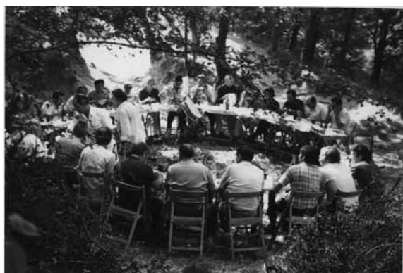
Aplec de la Taula Rodona de l'any 1973.