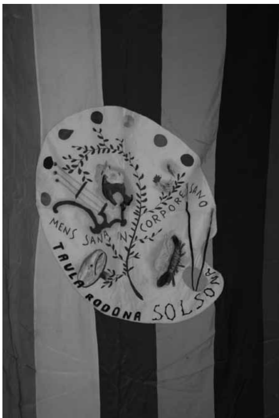
Bandera de la Taula rodona.

el 1950 per Jaume Serra i, aquell mateix any, Jaume Tarrés fa un parlament per commemorar el fet presentant la ponència “la nostra bandera”.