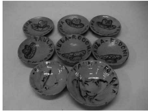
Plats fets per J. Pensí per a la Taula Rodona.

Dins la Taula Rodona no hi tenien cabuda les dones; l'entrada era restringida als homes. Així, només trobem la participació de les dones en algun dels actes que s'organitzen per homenatjar algun membre