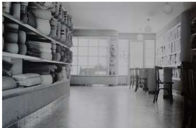
Interior de l'establiment als anys 40