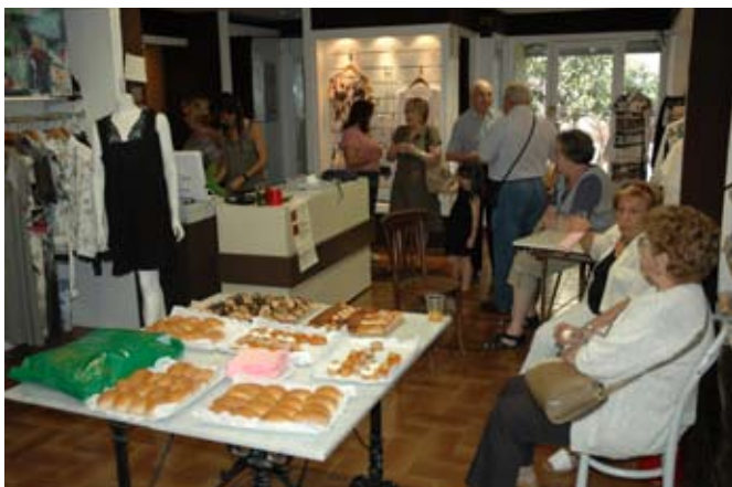
Amics i clients celebrant els 120 anys de Ca la Carme dilluns passat

El meu pare va fer l'aprenentatge a Can Jorba a Manresa. Va venir amb molta empenta per tornar a arrancar la botiga. Ca la Carme va ser de les primeres botigues que va tenir calefacció, un mirall i telèfon. Els que venien de pagès es quedaven admirats.