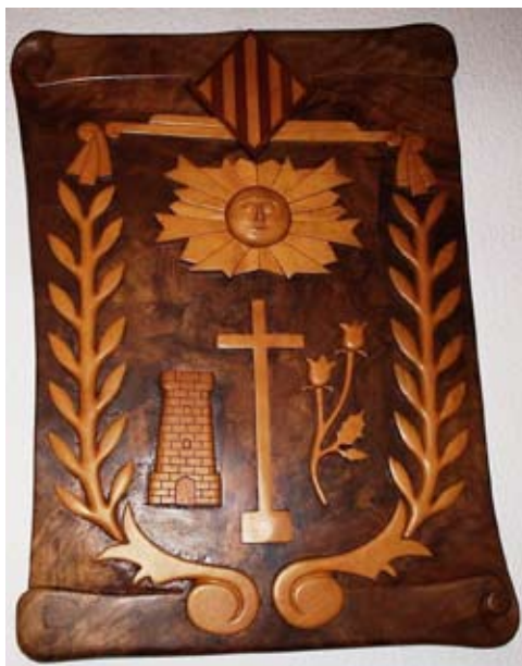
Un dels escuts heràldics de Solsona fets pel Guillermo