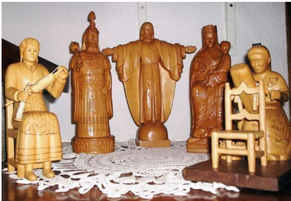
Figures fetes pel Guillermo, entre les quals la seva mare filant, el Gegant Vell de Solsona i la Mare de Déu del Claustre

tenir cura de la família i mantenir la llar (feines domèstiques, filar llana, fer jerseis a mà, confeccionar la roba de casa, vestits, pantalons... amb l'ajut de la màquina de cosir).