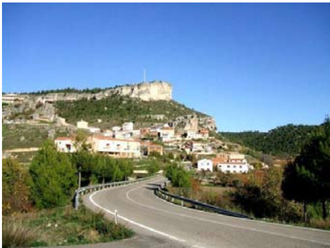
Cañizares (Serranía Alta de Cuenca). Foto actual

La mare -mestressa de casa- dedicava el seu temps a