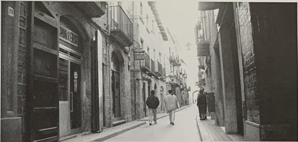
Façanes rústiques del carrer Castell, amb algun comerç que encara conserva els portals de fusta oberts contra les parets A primer terme podeu veure la xurreria i el pub L'Aixeta